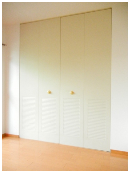
収納もバッチリです！