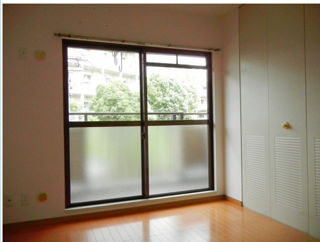
リフォーム済☆きれいなお部屋です。