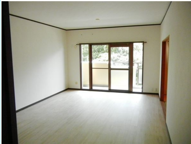
広々としたリビングダイニング♪陽当たり良好です！