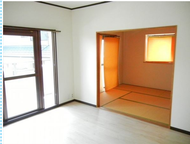
和室は二面採光でほっこり癒しの空間です。