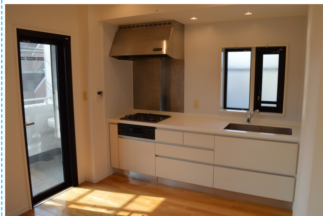
キッチンには三口コンロつき☆ゆったりとした調理スペースです♪