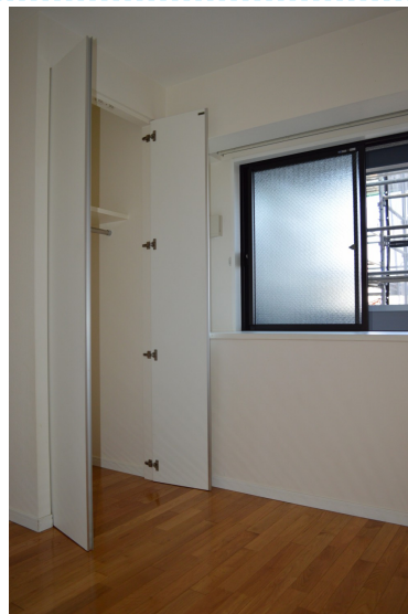
洋室は収納バッチリ♪