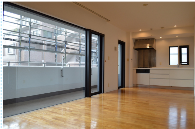
開放感あふれるリビング☆床暖房つきです♪